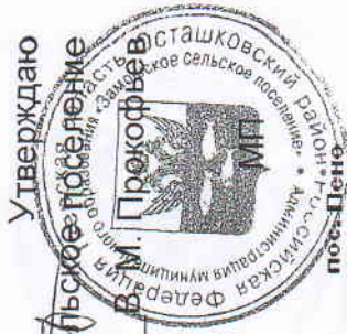
Схема водоснабжения п. Южный МО «Замошское сельское поселение»